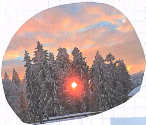
Schönes Ausblick beim Pferdestallwischen.

Ich habe gelesen dass man einer Ziege die keine Energie hat Cda einflüssen kann. Mein Ziel für die nächste Woche ist dass ich beim Köhe melken keine Hilfe brauche.