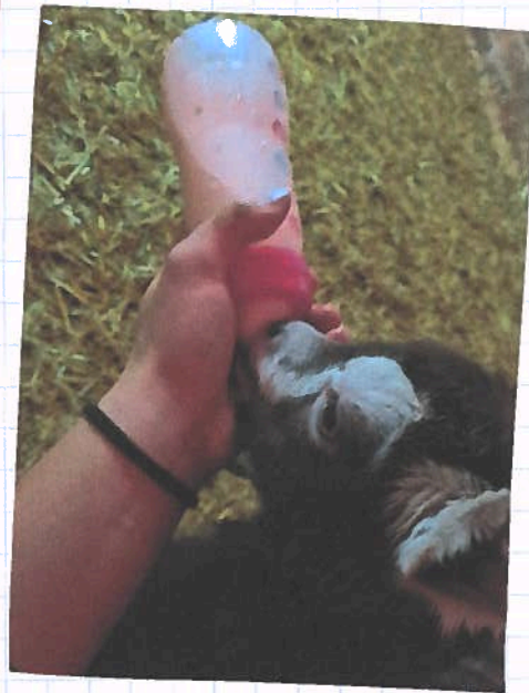
So sweeeeeeeet ♡♡