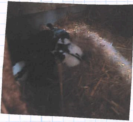
Die jungen Häschen