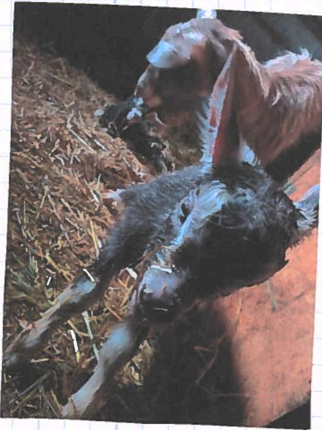
Geburt von Pêche