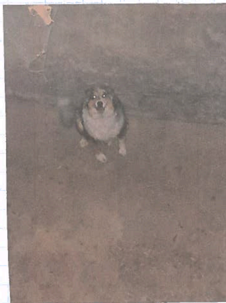
Molly im Silo Loch