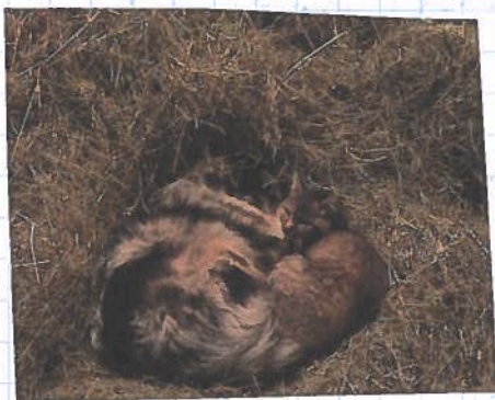
Pearl mit der Katze kuschelnd im Heu

Am Freitag bekam Kandy die eine Hündin neun Welpen. Ich freute mich als ich hörte dass Kokie und Novaarch bald Welpen bekommen würden. Ich freue mich auch sehr auf die Föhlen vom Pöng Stella und von der Freibergerstute Moonlight. Das Lowlight diese Woche war, das Ohrmarkieren bei der Gitzi. Sie meckerten immer so laut und schmerz erfüllt. Diese Woche habe ich gelernt dass 25kg Säcke sehr schwer sind denn ich konnte zwei Balletten umhertragen und neu stapeln.