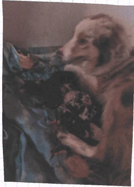
Kandy mit ihren frühgeboorenen Welpen