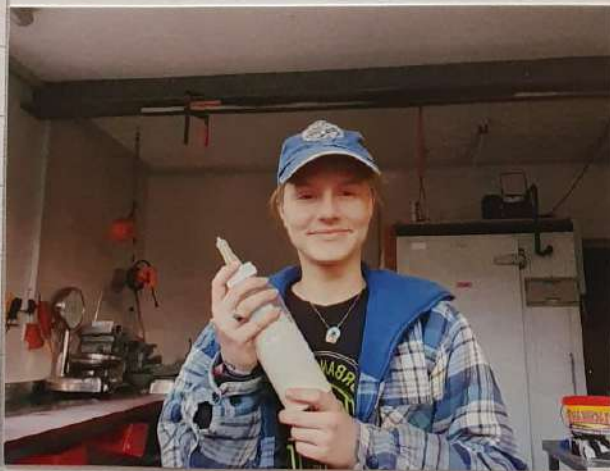
Ich darf „schöpfele“.