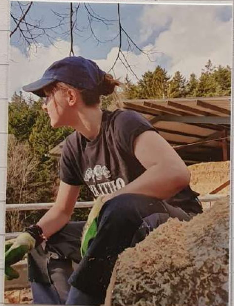
Do - Nachmittag → im T-Shirt ☺