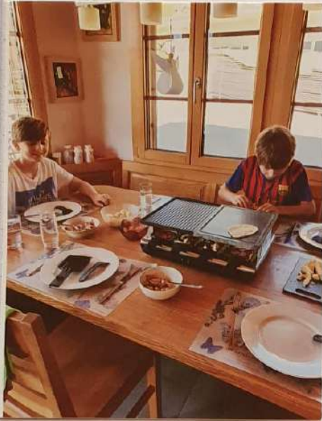
Mittwoch → Pizzali ♡