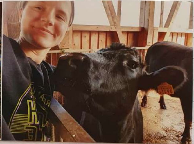
It's called Love!